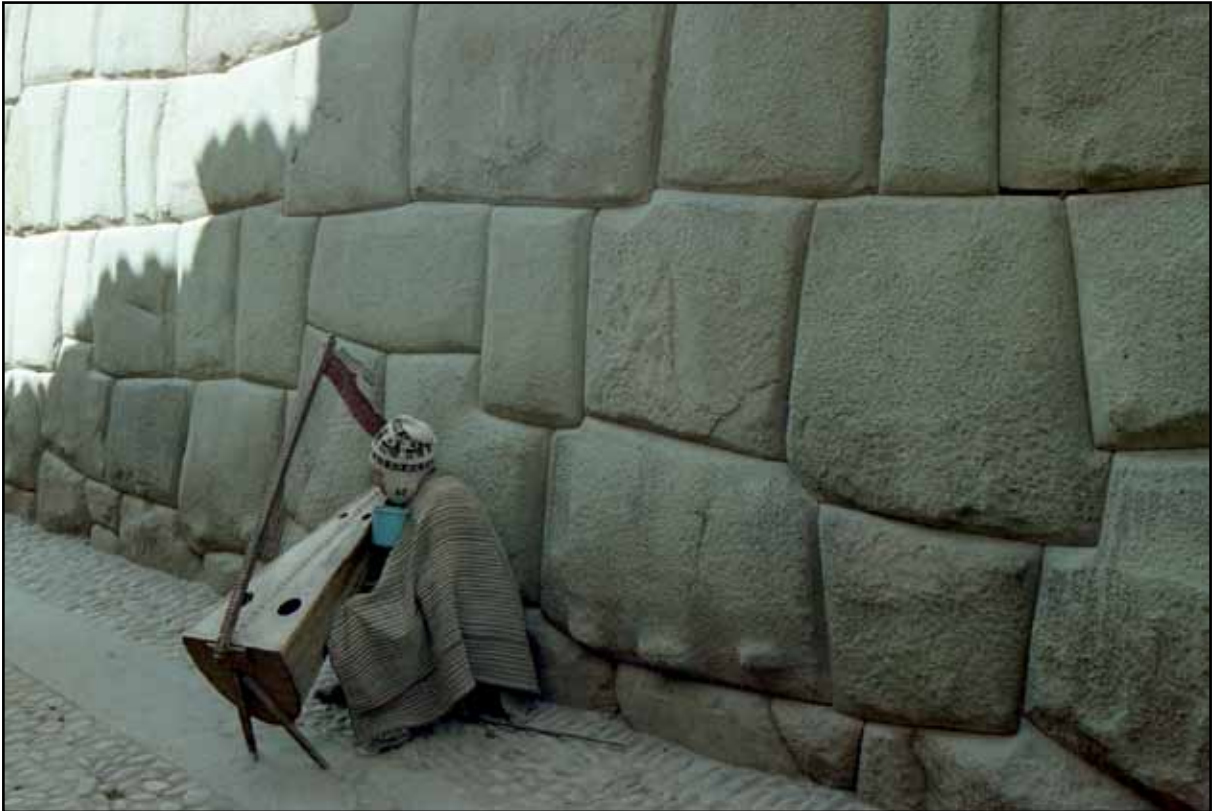
Afbeelding 16. Harpspeler tegen muur Incapaleis in Cuzco.