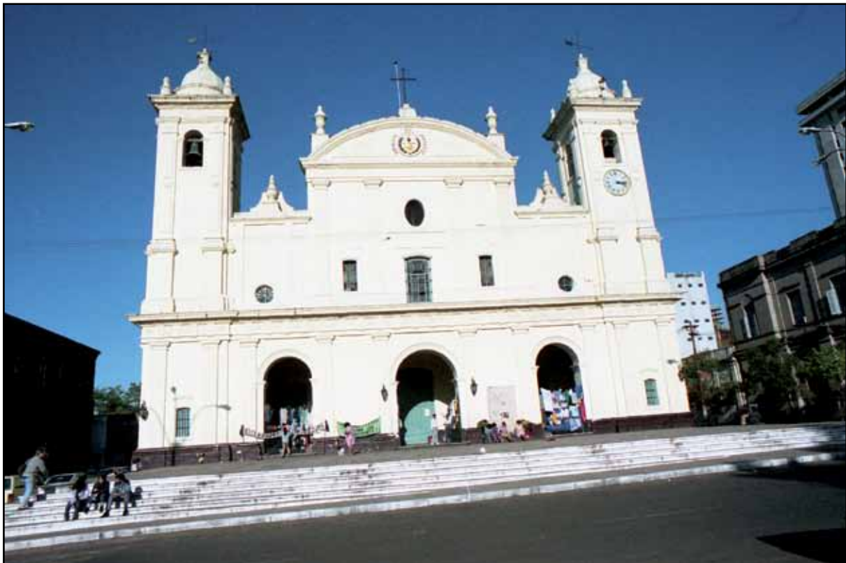
Afbeelding 4. Kathedraal met daar ter plekke wonende boeren, die om een rechtvaardige verdeling van de landbouwgronden vragen.

De 'Chaco burn-out' heeft zich gelukkig niet meer aangediend, alleen de buik die rommelt nog wat en voelt niet honderd procent. Maar toch gaan we vandaag het een en ander ondernemen. Per slot van rekening zit je niet elke week in Asunción. Tenminste dat dachten we, maar helaas hebben we buiten de kerk gerekend en aangezien zondag des heren rustdag is en Latijns Amerika nog steeds heftig katholiek is, is er in Asunción tijdens deze zevende dag gewoon geen hol te beleven. Dan maar een museumpje bezoeken en we kiezen het 'Museo Histórico Militar' dat zich op Avenida Mariscal López moet bevinden. We nemen een bus in die richting en na ongeveer