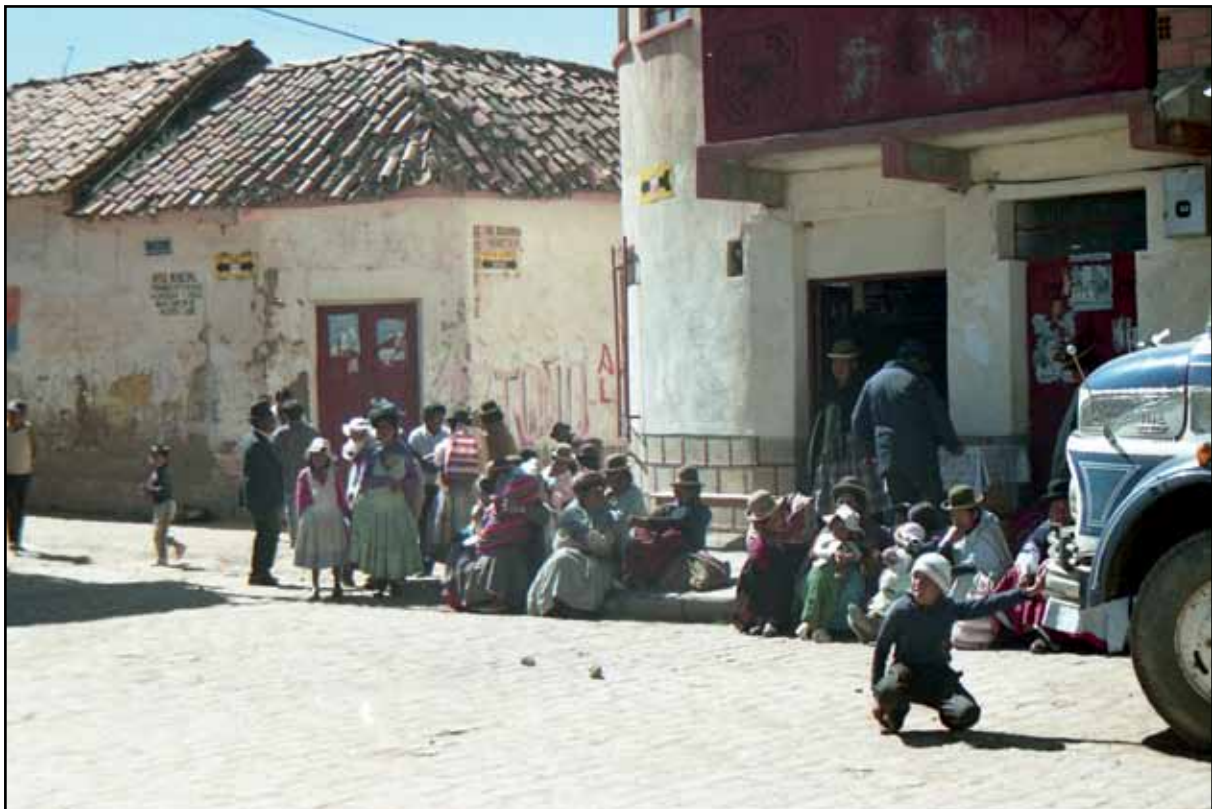
Afbeelding 13. De 'campesinas' wachten in spanning op de beroemde politicus.

Als ontbijt krijgen we in het hotel lekkere broodjes. We hebben bovendien goed geslapen. Het slapen op grote hoogte gaat namelijk niet altijd even goed, over het algemeen slaap je lichter en onrustiger op deze hoogten en dan droom je schijnbaar meer. Daarna gaan we wandelen en zoeken de Incaweg, die vinden we uiteindelijk maar niet dankzij het reisgidsje (de 'travel survivalkit' van Bolivia wordt door ons erg onvolledig gevonden). De weg is niet echt indrukwekkend, het had voor hetzelfde geld gewoon een slechte weg kunnen zijn. Op het plein in de stad worden voorbereidingen getroffen voor de komst van een of andere politicus. Kinderen marcheren af en aan, folklore groepjes huppelen op en neer en de geluidsinstallatie wordt uitgetest. We ontmoeten