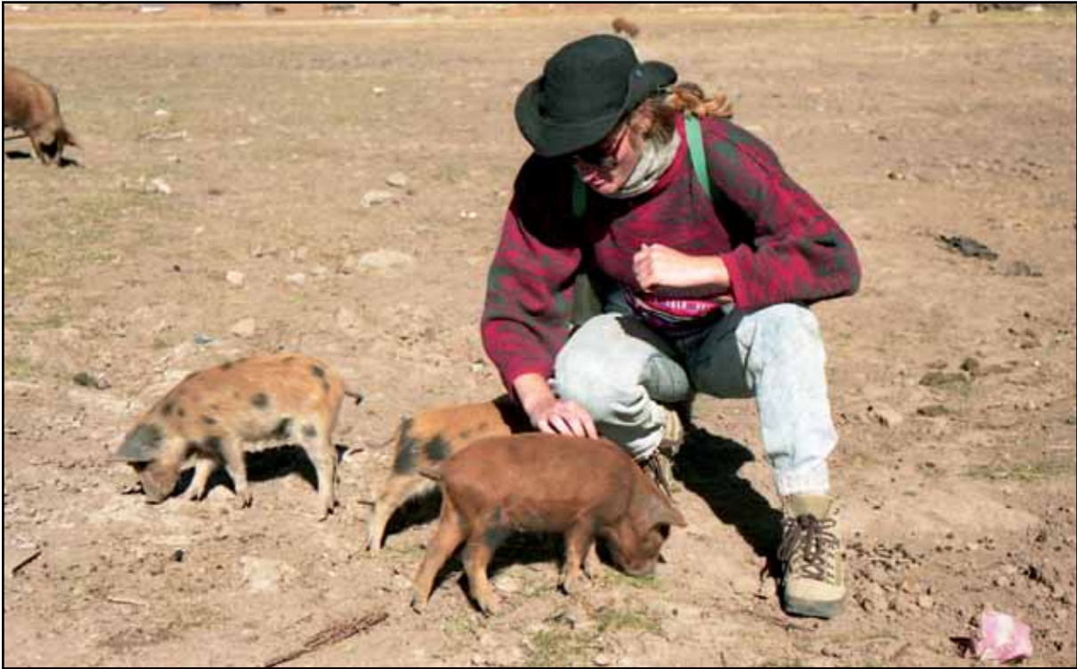
Afbeelding 14. Zuid-Amerikaanse varkentjes zijn ook leuk.