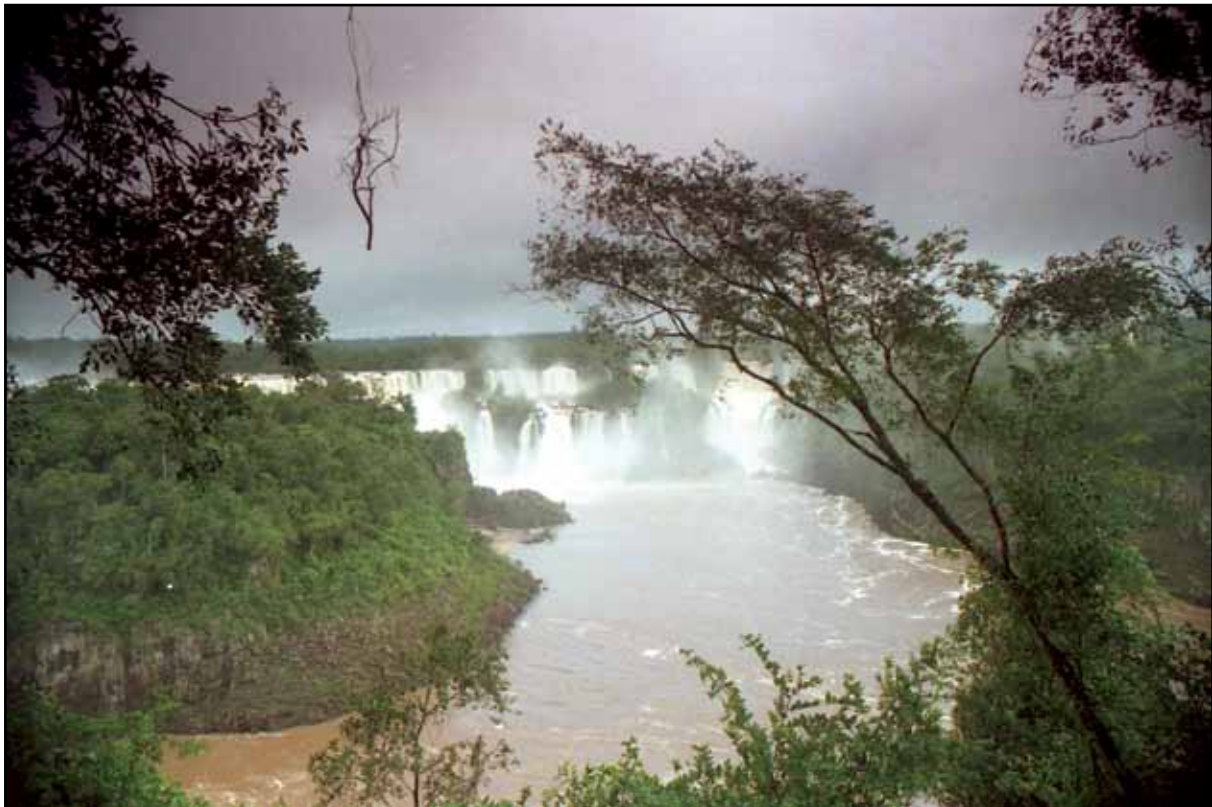
Afbeelding 3. De Iguazu watervallen.