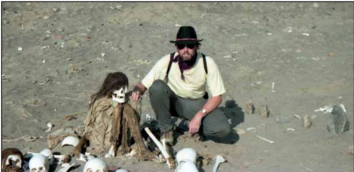
Afbeelding 26. Stokoude Indianen in Chauchilla.