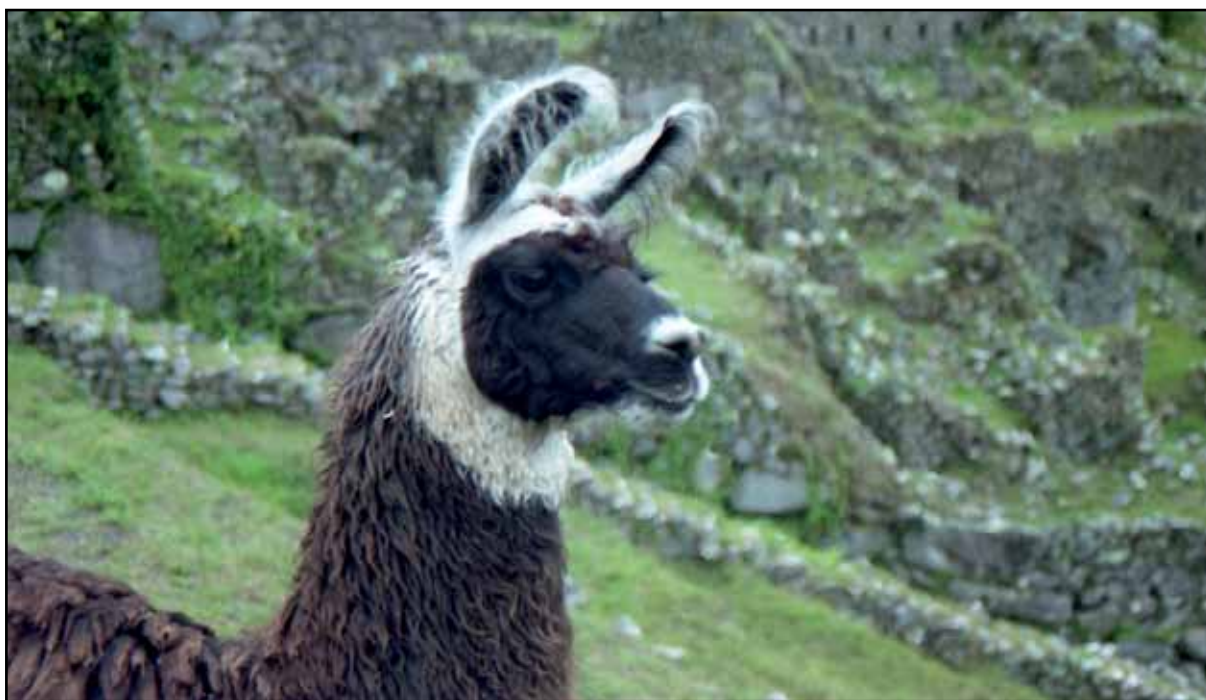
Afbeelding 21. Nieuwe vrienden in Machu Picchu.