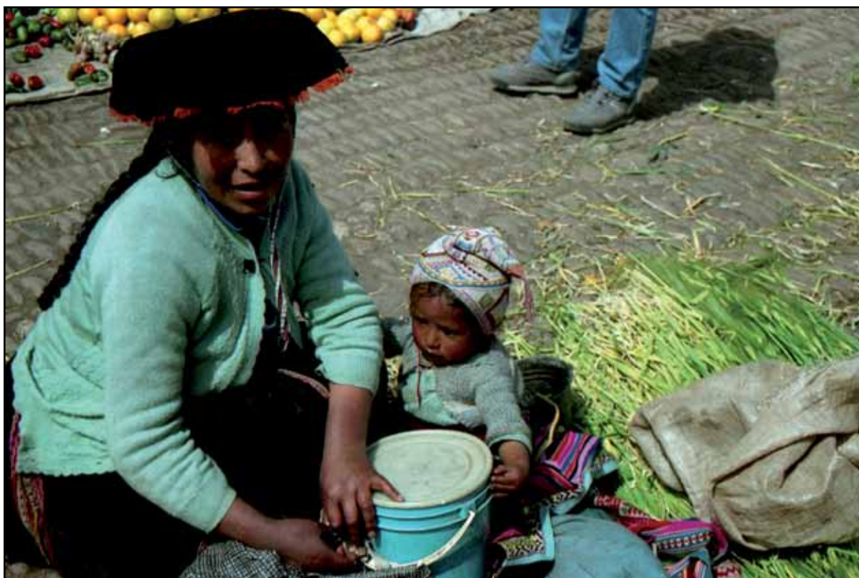
Afbeelding 18. Marktvrouw op de markt van Pisac..