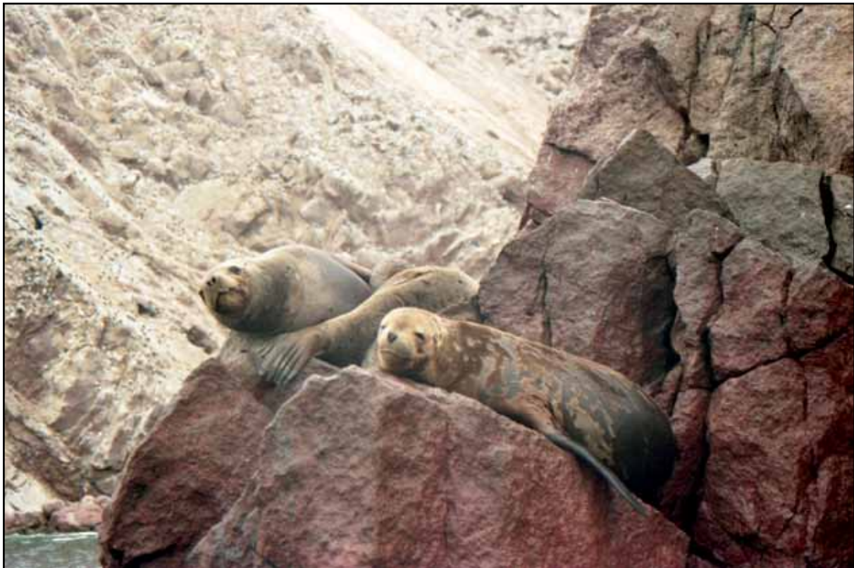
Afbeelding 28. Toeristje kijken vanaf een van de vele rotsen van Ballistas eilanden.