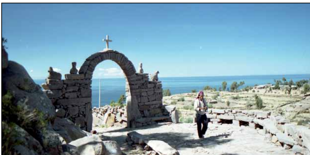
Afbeelding 15. Kantklossende man op het eiland Taquile in het Titicacameer.