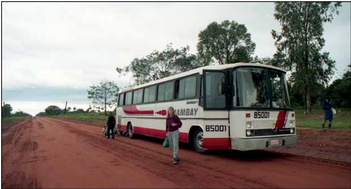
Afbeelding 5. Over de rode zandweg naar P.J. Caballero.