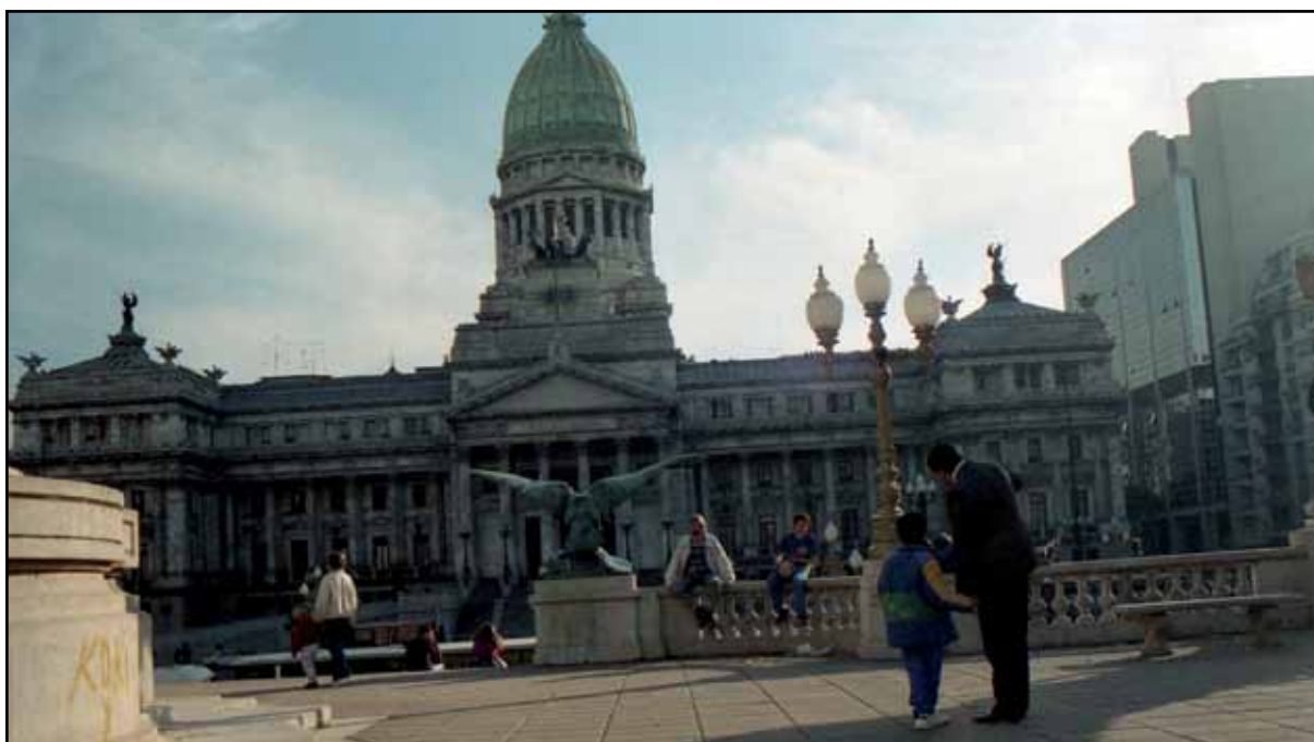
Afbeelding 29. Ergens in hartje Buenos Aires.

We worden om kwart voor tien wakker van getimmer op de gang. Ik voel me al weer wat beter en neem een hete douche. Daarna gaan we eten bij een sandwichbar waar we een aantal kleffe broodjes naar binnen wringen en ik meteen weer het gevoel krijg dat ik dat niet had moeten doen. Ergens in de stad dient een toeristenbureau te zijn en wij gaan naarstig op zoek. Eenmaal het ding gevonden hebbende vragen we aan de juffrouw wat de meest optimale manier is om naar het internationale vliegveld Ezeiza te komen. Ze vertelt ons het een en ander en stopt ons nog wat folders toe met onder andere een plattegrond van de stad. Op Plaza San Martin, dat