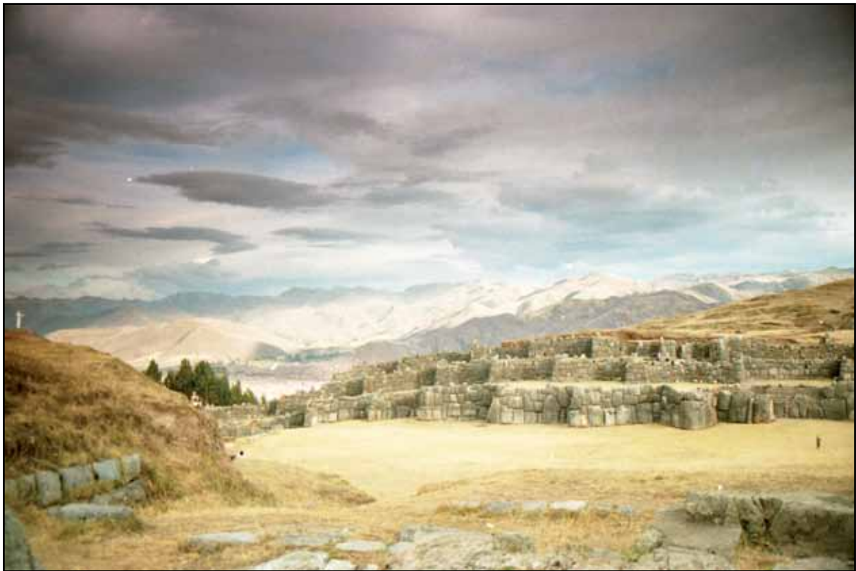
Afbeelding 17. Het fort Sacsayhuaman vanaf de heuvel Rodadero.