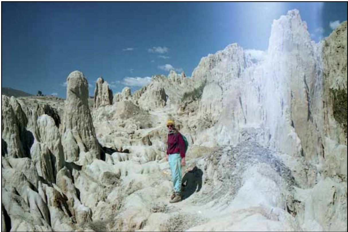
Afbeelding 12. We vinden ons terug in een futuristisch landschap.