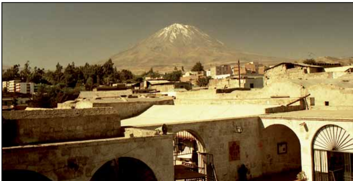
Afbeelding 25. De met sneeuw bedekte vulkaan El Misti.