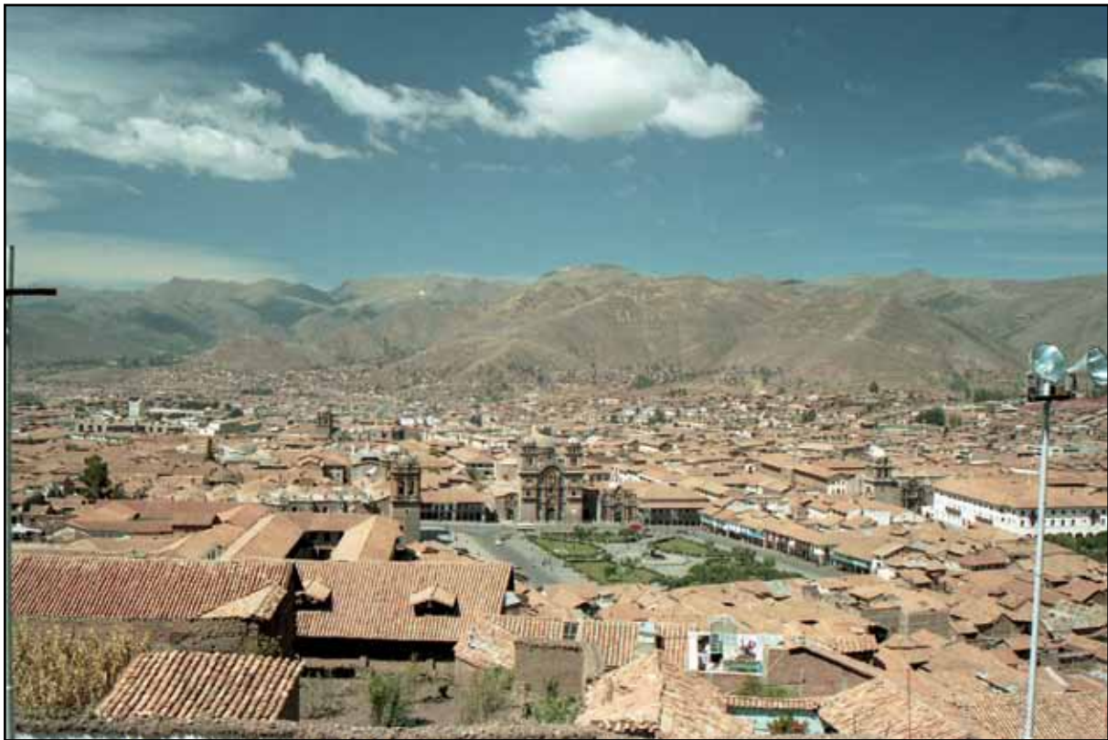
Afbeelding 24. Plaza de Armas in Cuzco vanaf Colcampata.

kocht nog zo'n lokaal warm hapje wat volgens haar goed smaakte, tamalis of zo genoemd. Men kon dit spul kopen met een zoete of een zoute smaak en ze werden gewikkeld in maïsbladeren warm aangeleverd. Zo hebben we tenminste ook een keer de sfeer kunnen proeven in een lokale Peruaanse trein, waarin de passagiers niet zo in de watten worden gelegd als in de 'autovagn' of nog duurder, de toeristentrein. Om één uur 's middags kwamen we in Cuzco aan en gingen rechtstreeks vanuit het station iets eten bij Ayllu (deze zaak ligt net langs Yunta). In het hotel (weer in de Conquistador) een douche genomen om het vuil van de dag af te spoelen en daarna wat uitgerust van de reis. Het restaurant voor het avondeten werd Urpi op Calle Procuradores, een chaotische tent, wel lekker maar een beetje duur. Om tien uur 's avonds stonden we voor het hotel met een gesloten deur. Na een aantal malen bonzen verscheen de gestalte van 'Manuel' en hij liet ons binnen.