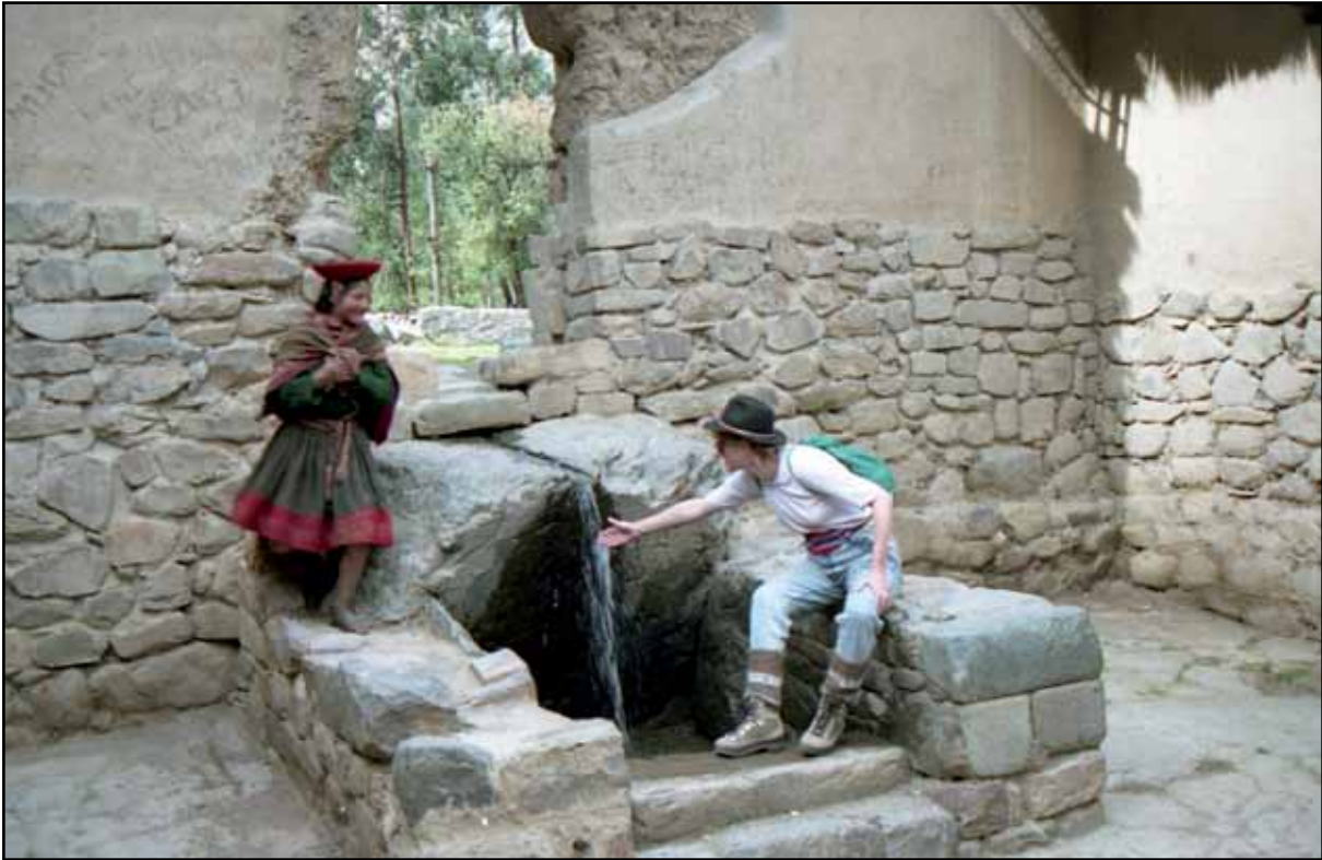
Afbeelding 19. Magisch moment in een 'Baño del Inca' in Ollantaytambo.