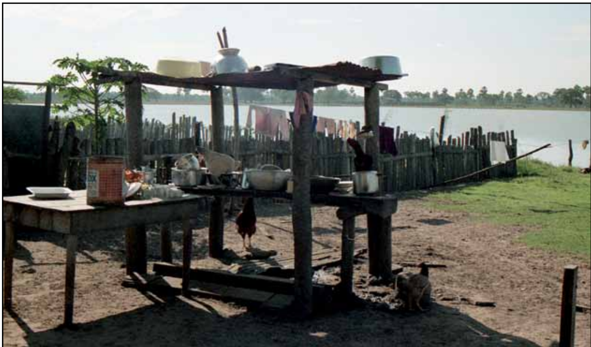
Afbeelding 7. De keuken van ons 'hotel' in de Pantanal.

's Morgens in de hangmat beginnen mijn voeten toch iets koud te worden, maar gelukkig komt de zon al op en kunnen we snel genoeg opstaan. Het wassen geschiedt in de rivier. Het ontbijt bestaat uit geroosterd brood, ananas, ei, warme melk en koffie. Voor vanmorgen staat een tocht per pick-up op het programma en piranha's vangen voor vanmiddag. Het eerste gaat echter niet door vanwege technische problemen met het voertuig. Enkele satelliettandwielen van het differentieel