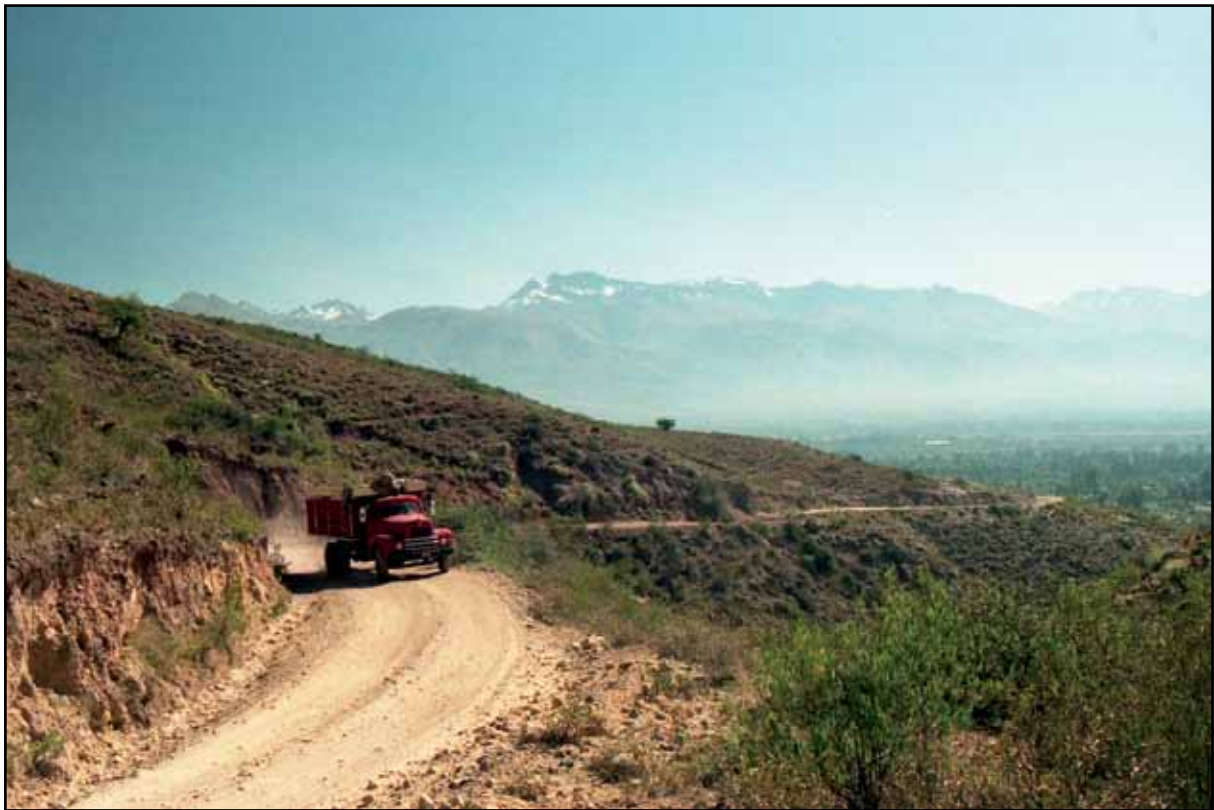
Afbeelding 8. Op weg naar Inca Rakay kan ook met een truck.

onze antiwormen kuur. De pot heeft nog niet als onweerstaanbare magneet gefungeerd. Een goed teken. Met de Belgen hebben we als diner een chinees genoten aan Plaza Colón. Hier ontstond enige verwarring over de bestelling met als resultaat dat de nodige nabestelling wel snel aanwezig, maar niet optimaal was. Eens kijken of dat morgen sanitaire gevolgen heeft.