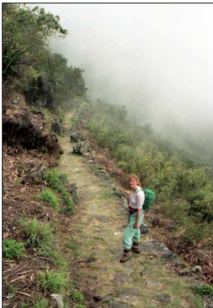
Afbeelding 23. Stukje Incatrail in de mist.

Van hieruit lopen we verder richting Huayna Picchu en komen zo door het koninklijke kwartier. Dit wordt zo genoemd omdat de gebouwen hier groter en wat ruimer van opzet zijn dan in de rest van de stad. Van het koninklijke kwartier komen we in de religieuze sector. We vinden hier de tempel van de drie vensters (de naam zegt al genoeg), de hoofdtempel en het midden van de twee tempels een reusachtige steen welke als offeraltaar gediend zou kunnen hebben. Achter de hoofdtempel bevindt zich de sacristie waarin een aantal nissen en een vlakke granieten blok te bezichtigen zijn. Lopen we verder dan komen we uit bij Intihuatana, oftewel de zonnewijzer. De precieze functie van deze steen met een merkwaardig uitsteeksel naar boven is niet echt bekend, maar het is goed mogelijk dat het hier gaat om een of ander astronomisch instrument. Intihuatana is Quechua en het betekent zoveel als 'de plek waar de zon wordt vastgehouden'. Intihuatana verlatend steken we het lager gelegen hoofdplein over en komen in de