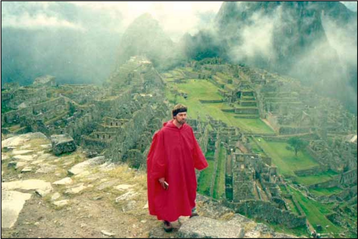
Afbeelding 22. De auteur kwam, zag en bewonderde Machu Picchu.