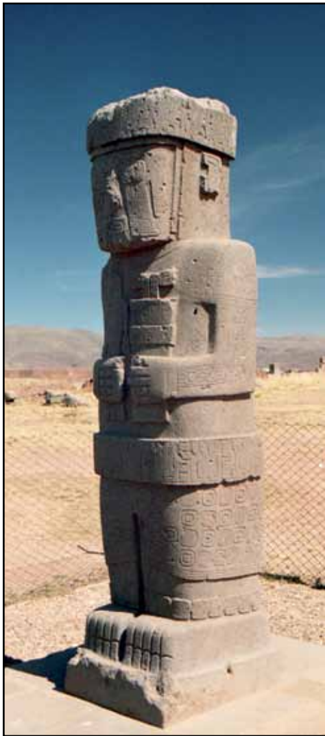
Afbeelding 10. Een levensgroot beeld op de site van Tiahuanacu.