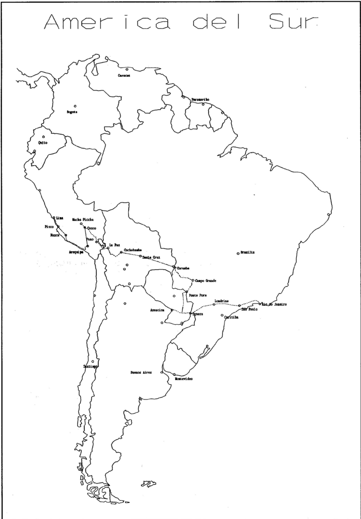
Afbeelding 1. De queeste door het Zuid-Amerikaanse land.