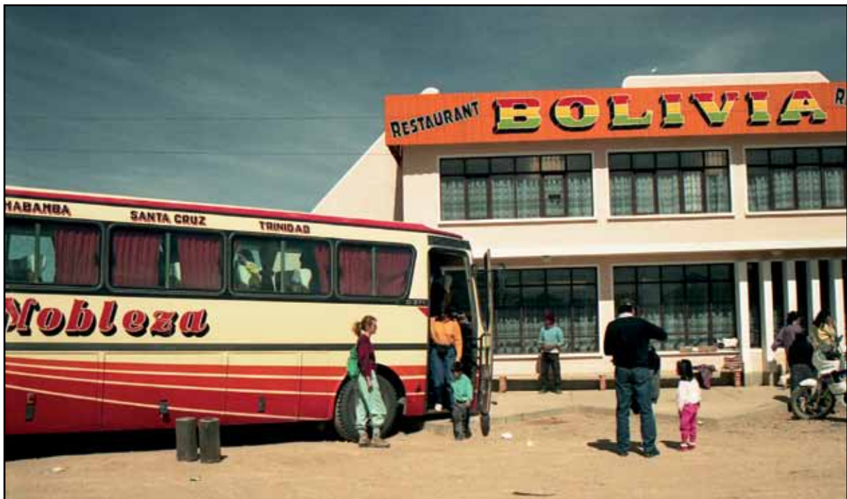
Afbeelding 9. Met de bus over de Altiplano naar La Paz.