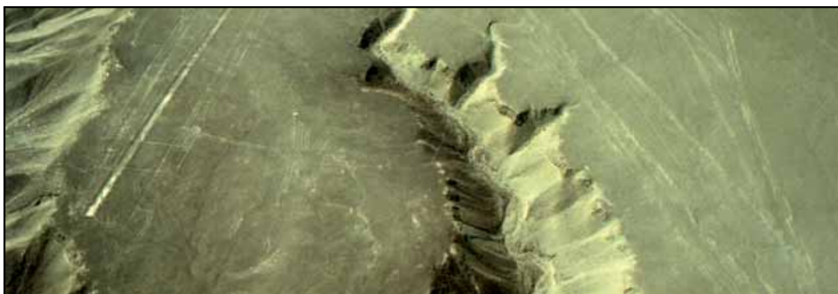
Afbeelding 27. Probeer de vogel te spotten in de Nazca-vallei..